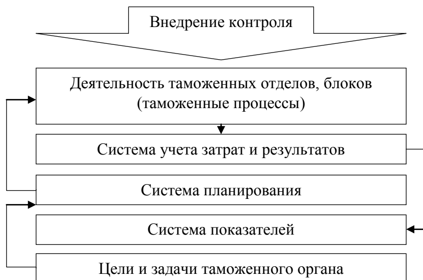
Рисунок 2. Структура управления таможенными органами на основе метода контроля

Структура управления таможенными органами на основе метода контроля, с учетом представленных ранее элементов, представлена на рисунке 2.