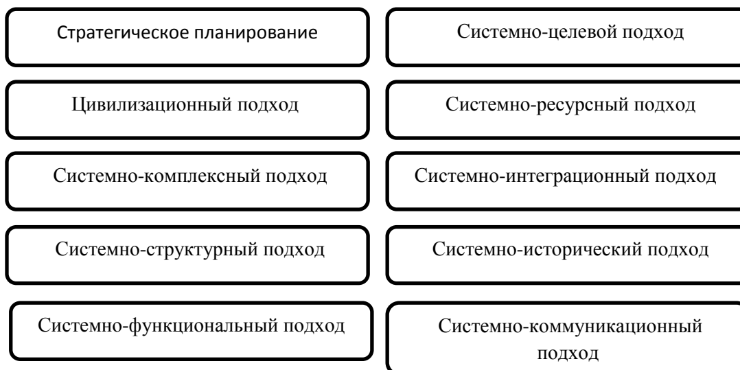
Рисунок 4. Основные подходы стратегического планирования

В процессе своей деятельности фирма сталкивается с разными угрозами и возможностями, они могут носить экономико-политический характер (дефляция и инфляция), рыночный (проникновение на рынок), международно-технологический (создание новых технологий предприятия за счет легкодоступности к материалам). При этом учитываются факторы конкуренции и социального поведения, так как они наиболее переменчивы.