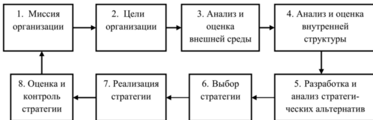
Рисунок 2. Основные этапы стратегического планирования на предприятии

Основные этапы стратегического планирования на предприятии можно увидеть на рисунке 2: