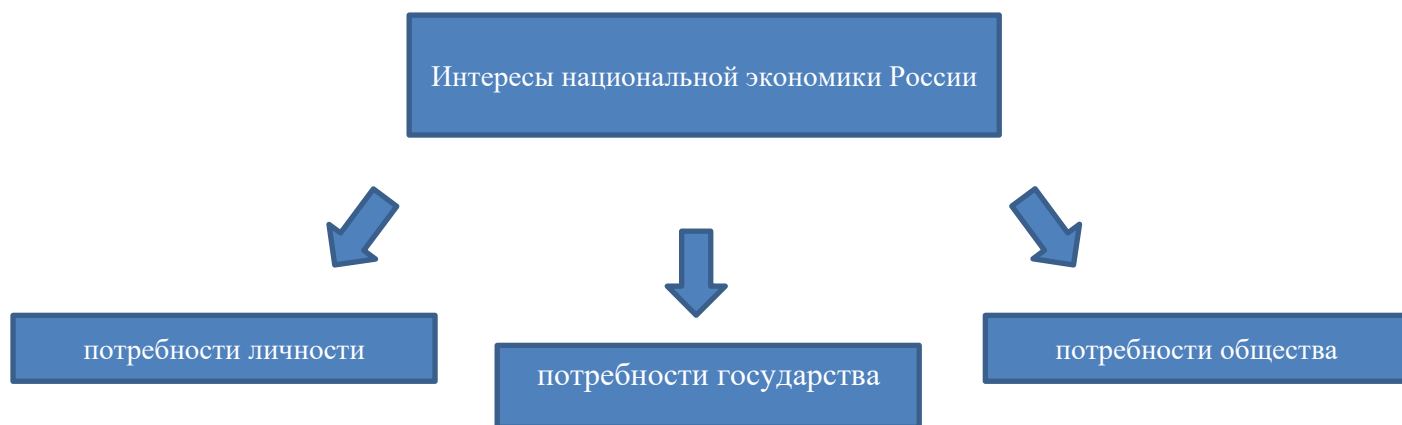
Схема 2. – Совокупность интересов национальной экономики России

Невозможно утверждать, что интересы вышеперечисленных субъектов сбалансированы, поскольку их настоящие интересы различные и изменчивые.