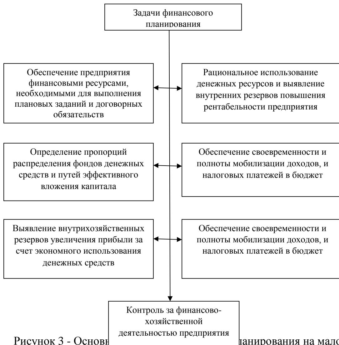
Рисунок 3 - Основные задачи финансового планирования на малом предприятии

Этапы финансового планирования показаны на рисунке 7.