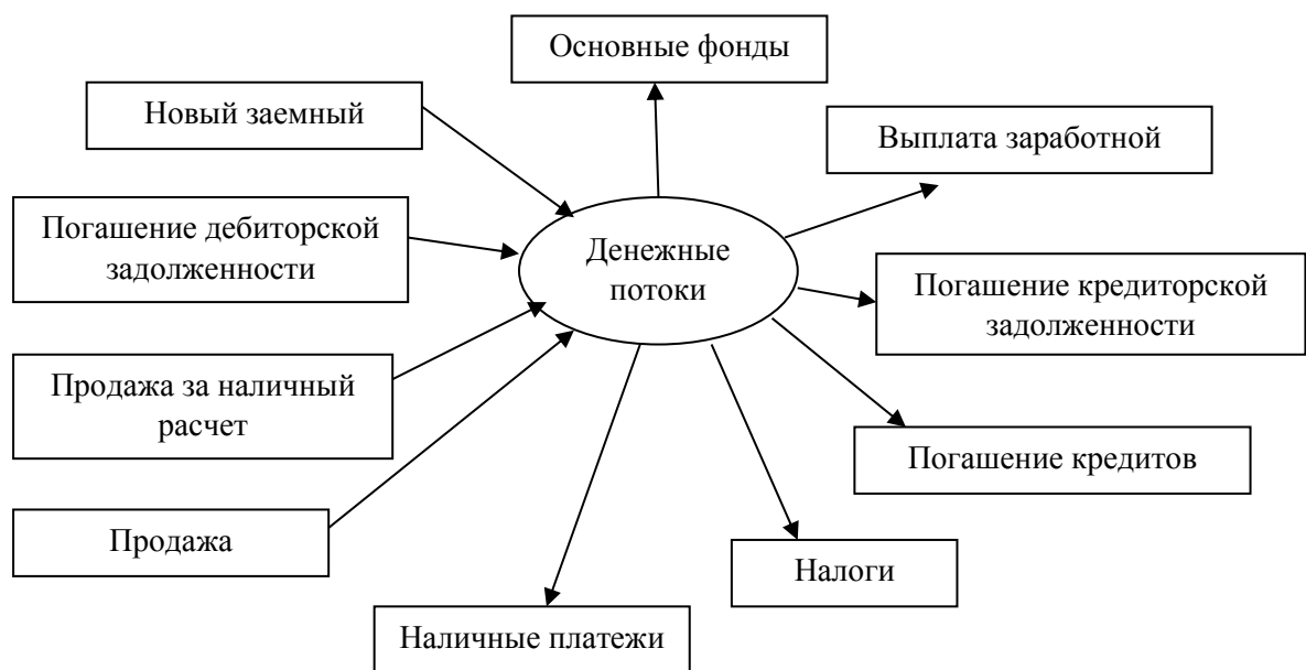
Рисунок 2 - Денежные потоки на малом предприятии

Все финансовые отношения малого предприятия можно рассмотреть по денежным потокам (рисунок 2).