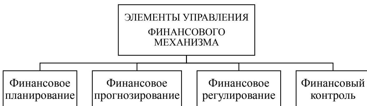
Рисунок 1-Элементы управления финансового механизма

В структуре регионального финансового механизма выделяют классические элементы управления, представленные на рисунке 1.