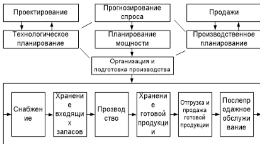
Рис. 1. Схема составления расходов и создание цены продукции. Представленная

схема дает возможность выявить конкретные принципы по гарантиям качества. Так же отсюда можно увидеть на каком этапе процесса они (принципы) реализуются.