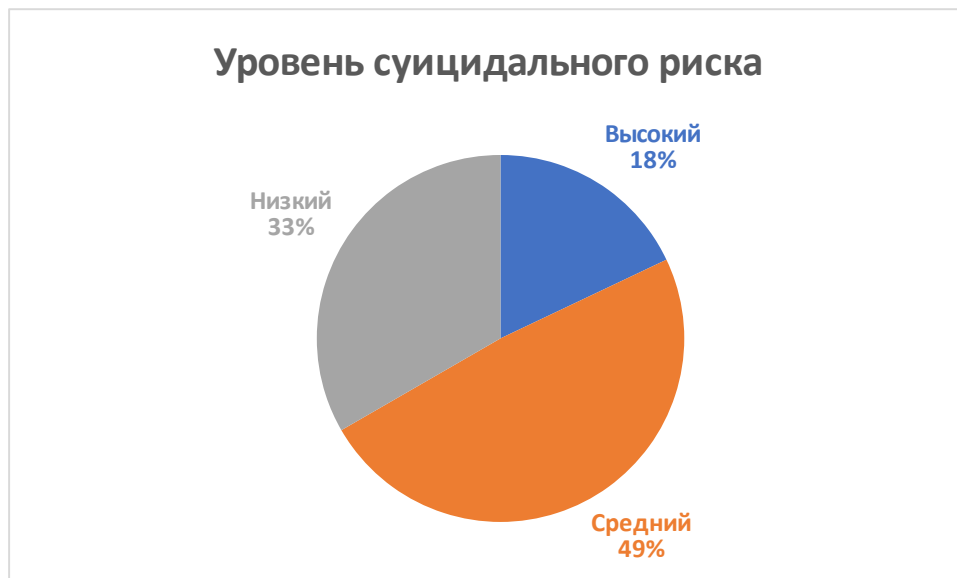
Рис. 1. Уровни суицидального риска подростков

На рисунке видно, что около половины испытуемых (49%) характеризуются средним уровнем суицидального риска. Это говорит о возможности формирования суицидальных намерений у данной категории испытуемых