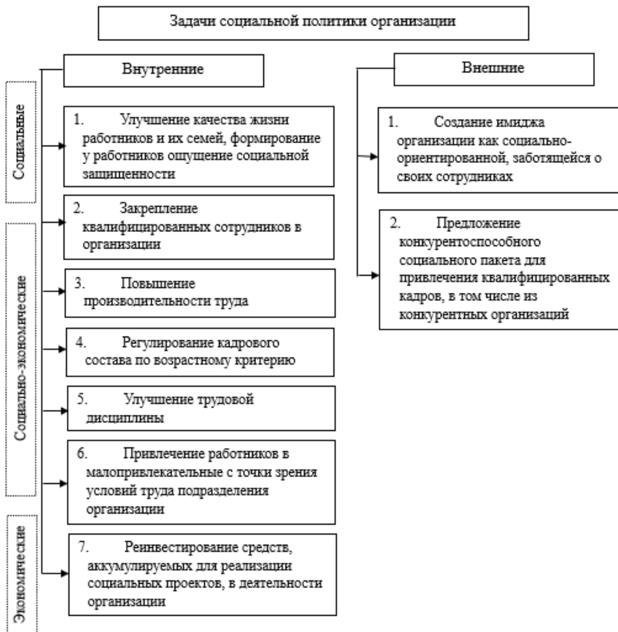
Рисунок 1 – Задачи социальной политики организации

Формирование корпоративной социальной политики находится под влиянием внешних и внутренних факторов (рис. 2).