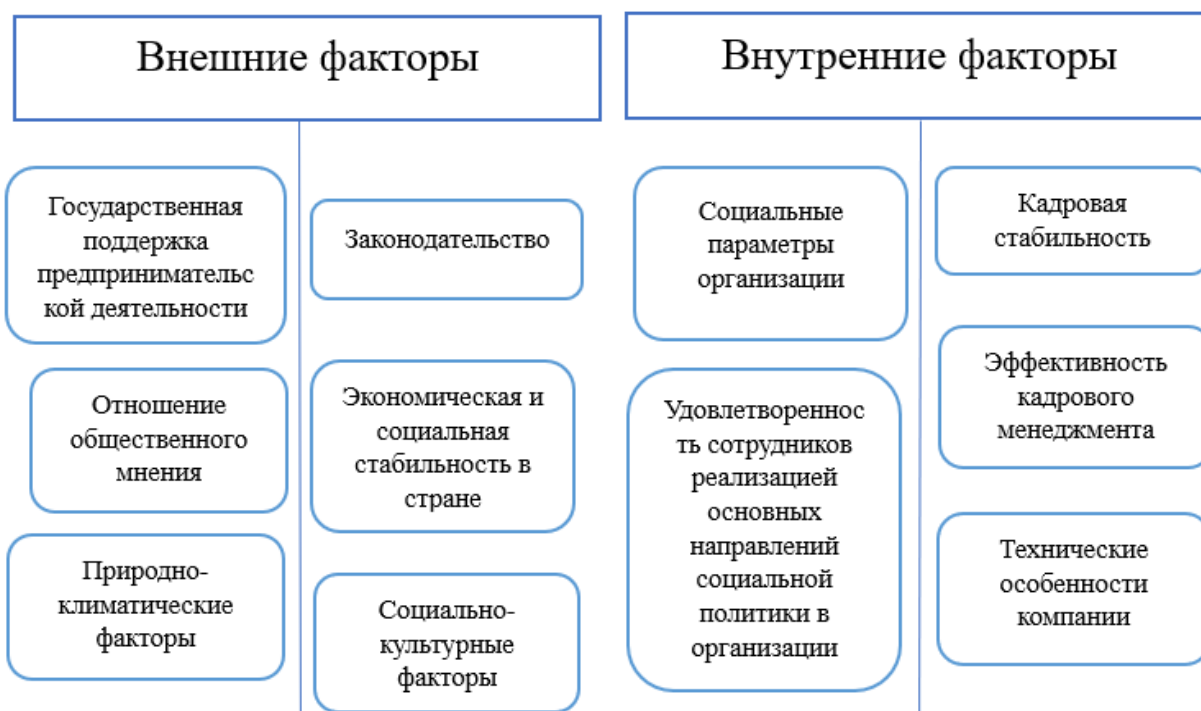
Рисунок 2 – Факторы, влияющие на формирование социальной политики

Формирование корпоративной социальной политики должно основываться на ряде принципов, которые наглядно отражены на рис. 3